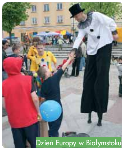
Dzień Europy w Białymstoku

Pracownicy Punktów biorą również udział w spotkaniach organizowanych przez inne instytucje i organizacje. Sami także organizują seminaria, kursy i spotkania informacyjne dla wnioskodawców i beneficjentów RPOWP. Od początku roku przeszkolono 524 osoby. Konsultanci pracujący w Punktach korzystają ze środków pomocy technicznej, systematycznie poszerzając swoją wiedzę i kwalifikacje.