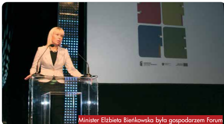
Minister Elżbieta Bieńkowska była gospodarzem Forum →

Raz w roku w Warszawie odbywa się wielkie święto, będące równocześnie podsumowaniem kolejnego okresu wydawania unijnych środków, przeglądem dokonań na tym polu, spotkaniem zaangażowanych instytucji i osób.