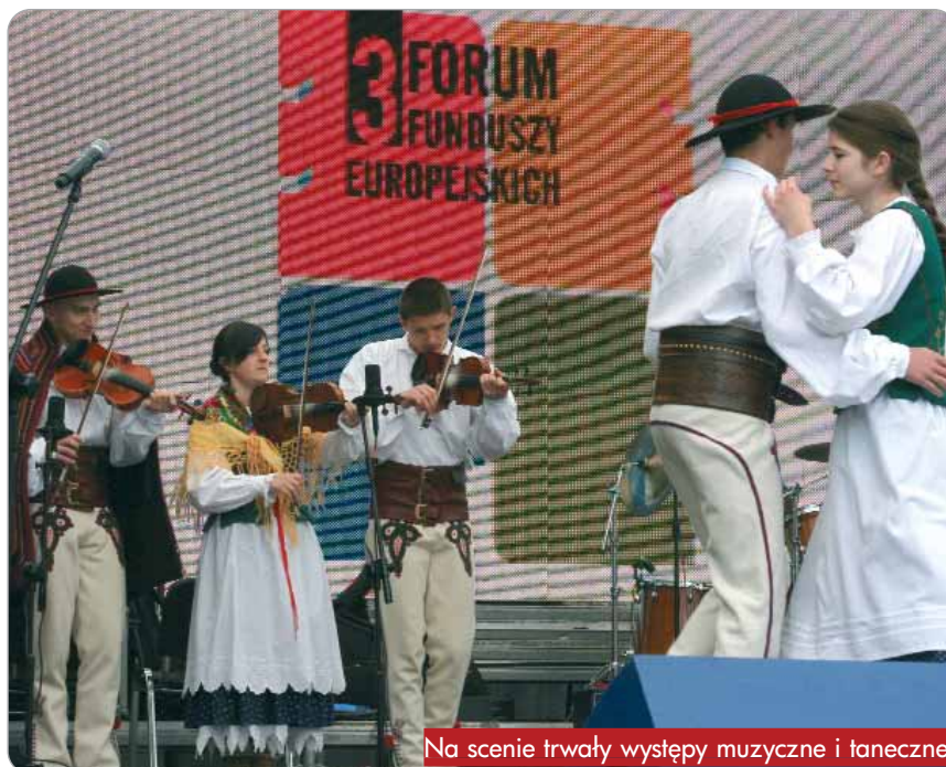
Na scenie trwały występy muzyczne i taneczne

W kategorii Produkt promocyjny – Województwo Dolnośląskie za projekt „Promocja markowych produktów turystycznych Dolnego Śląska”.