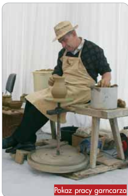
Pokaz pracy garncarza